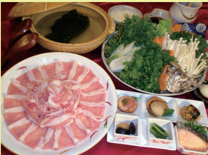
地豚ロース & たっぷり野菜鍋