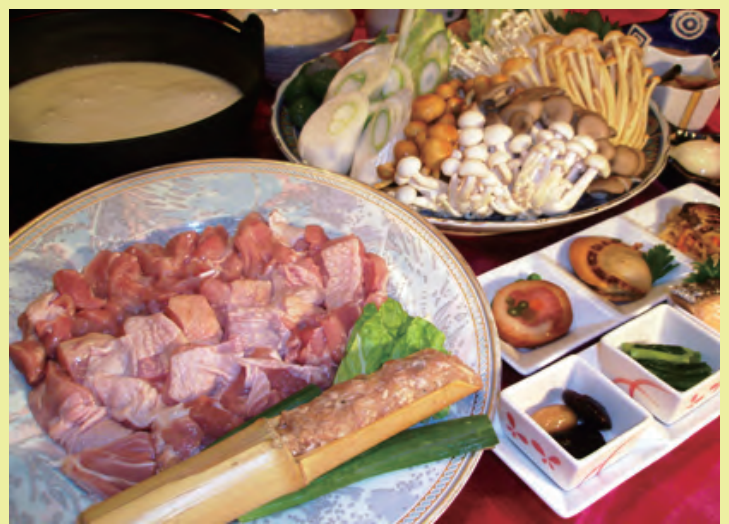
国産若鶏 & たっぷりきのこ野菜豆乳鍋