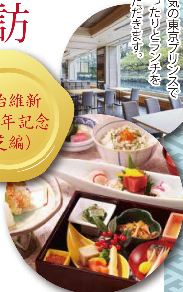
季節のオリジナル御膳 ※写真はイメージです